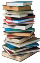
Milyonlarca yılda üretilen bilgi

Bilmek kelimesinden gelen " bilişim " kelimesinin çok farklı tanımları yapılmaktadır. İşin özü kelimenin köküyle yani BİLMEK ve BİLGİ ile ilgilidir. Günümüzde dünyadaki en büyük güç bilgidir . Dünya üzerindeki bilgi miktarı o kadar hızlı artmaktadır ki günümüzde bilgi patlaması yaşanmaktadır. İnsanların milyonlarca yıldır ürettikleri bilginin tamamından daha fazlası günümüzde bir yıl gibi kısa bir zamanda üretilmektedir. Çünkü artık bilgiye ulaşmak ve bilgiyi yaymak bilgisayar ve iletişim teknolojisindeki hızlı gelişmelerle çok kolaylaşmıştır.